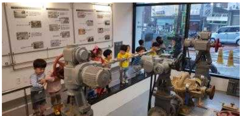
또바기 가압장 견학 프로그램 운영