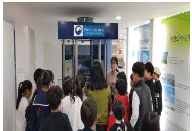
수영 에코키즈맘 현장학습