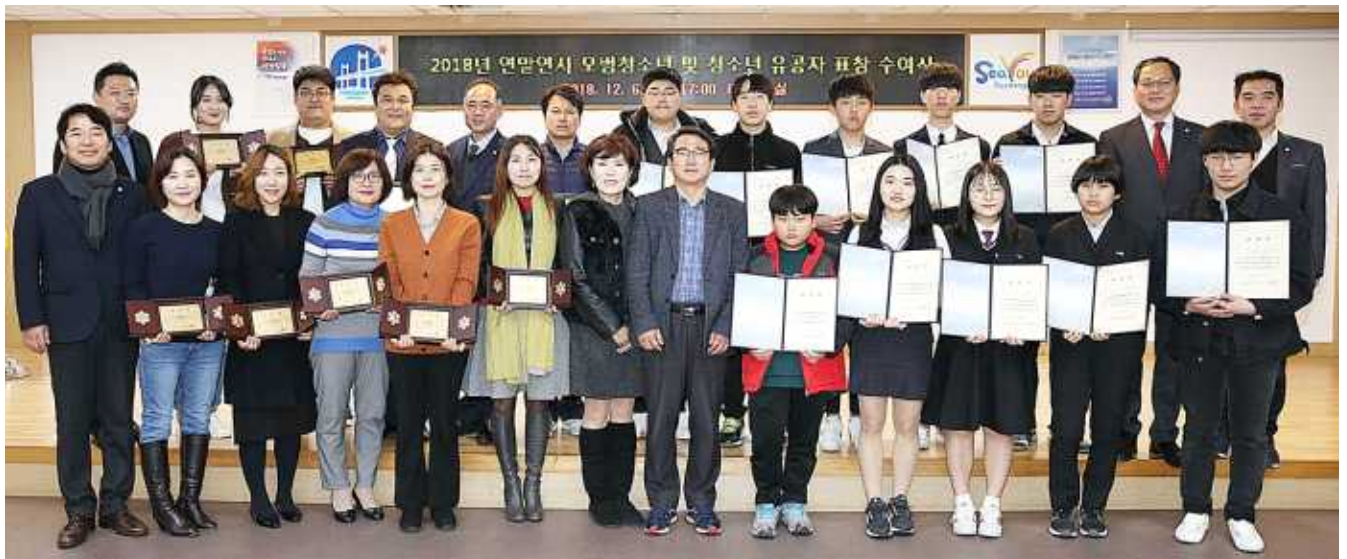
모범청소년 및 청소년 유공자 표창 수여식