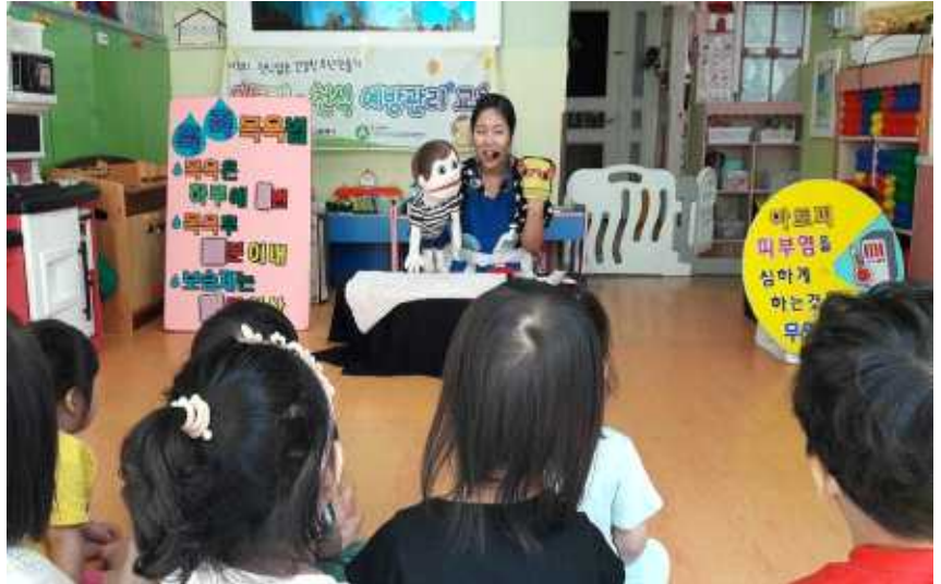
아토피·천식 예방관리 교육