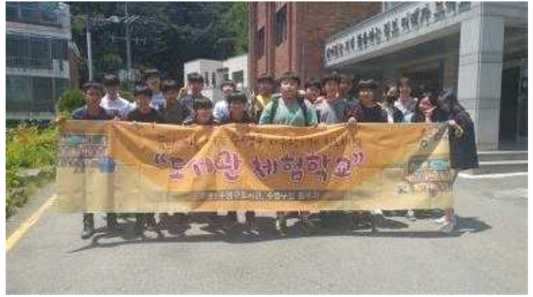
수영구 자유학기제 연계 도서관 체험학교