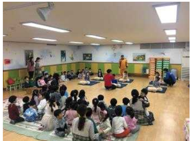
찾아가는 어린이 안전교실