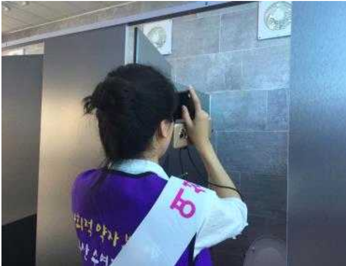
공중개방화장실 몰래카메라 설치유무 점검