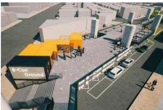
B-Con 그라운드 조감도