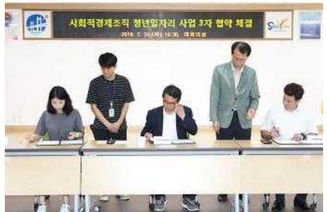
사회적경제조직 청년일자리 사업 3자 협약 체결