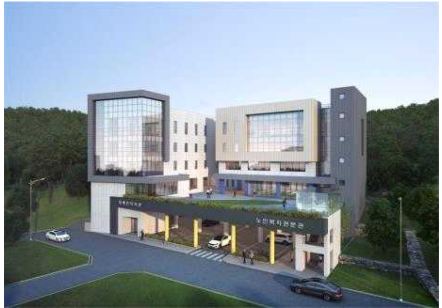
노인복지관 분관 및 장애인복지관 조감도