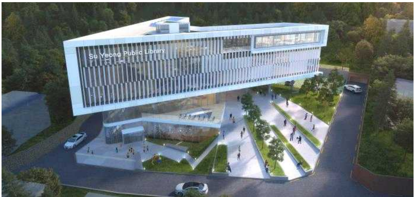
수영구 도서관 재건립 사업 조감도