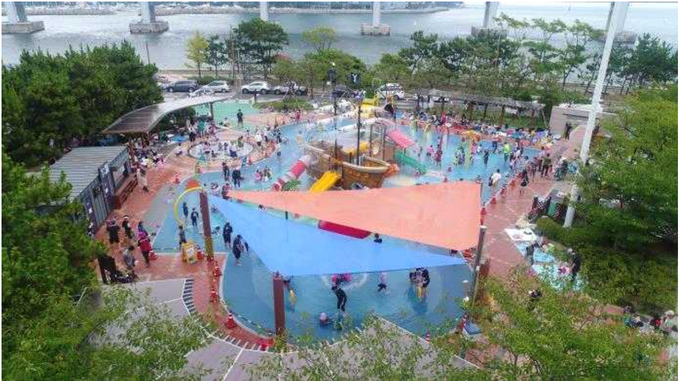
수영구 어린이 워터파크