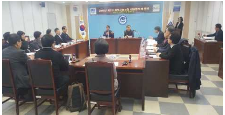
지역사회보장 대표협의체 회의