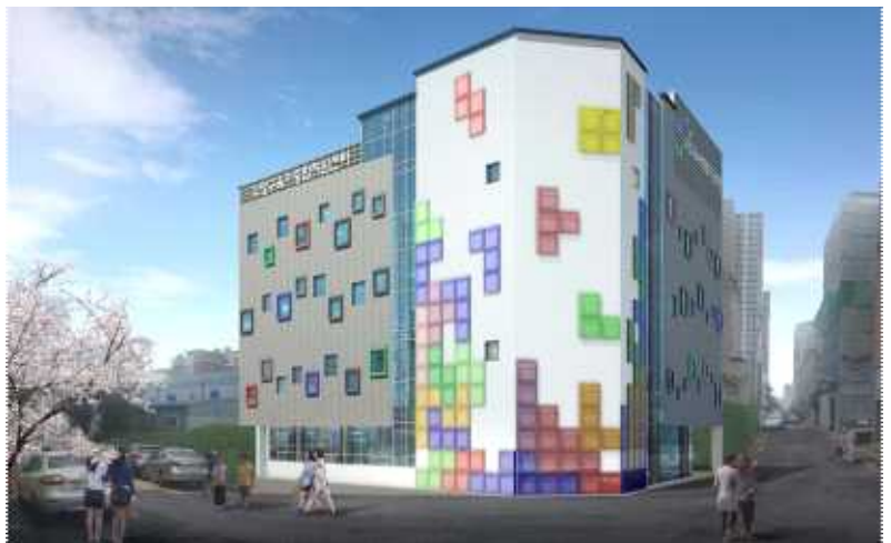
수영구 육아종합지원센터 조감도