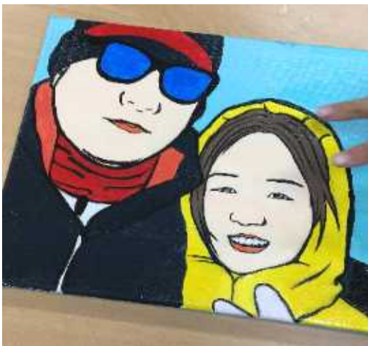
행복을 그리는 시간 - 우리가족 팝아트 그리기