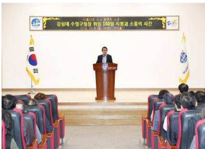
직원과 소통의 시간