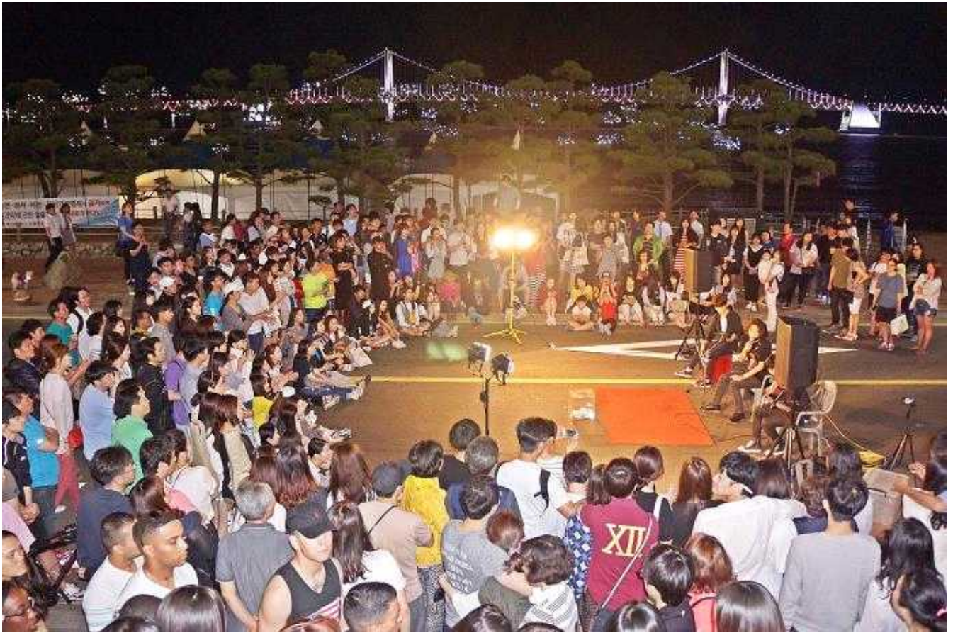
차 없는 문화의 거리