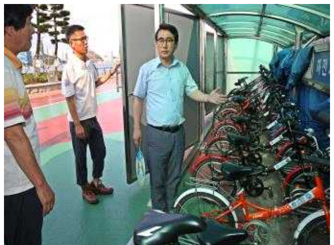
공영자전거 무료 대여소 시설점검