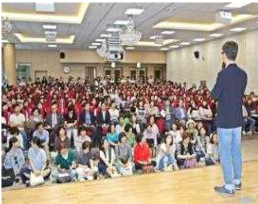
수영 행복 아카데미