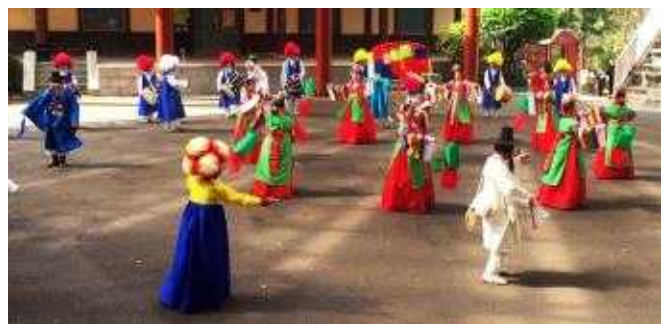
수영의 들놀이, 탈놀이