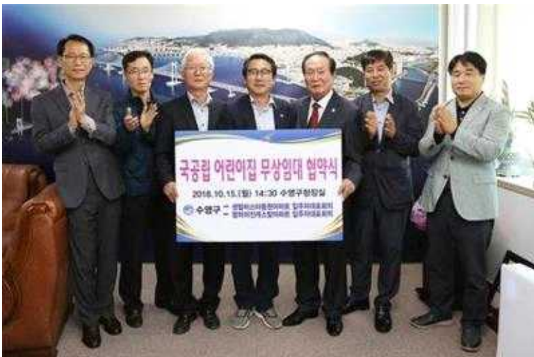
국공립 어린이집 무상임대 협약식