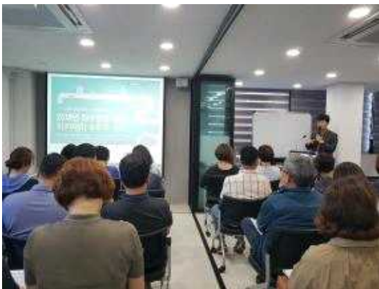
좌수영성 일원 재창조 아카데미