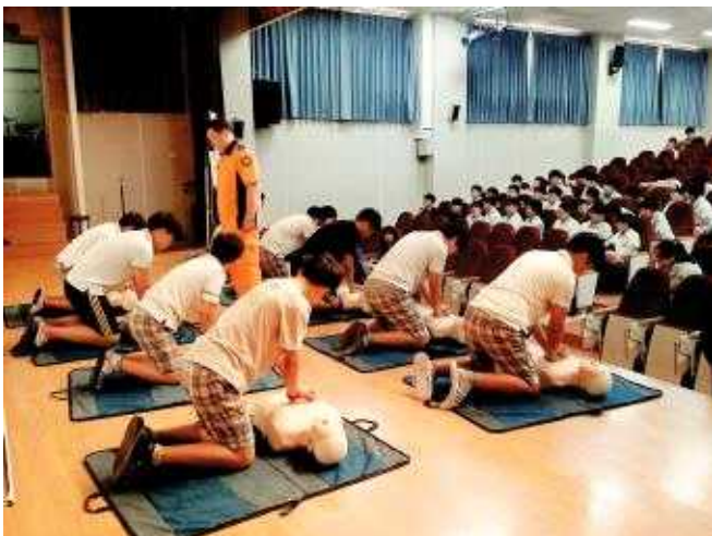
중·고등학생 생활안전 방문교육