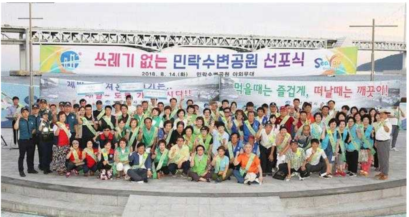
쓰레기 없는 민락수변공원 선포식