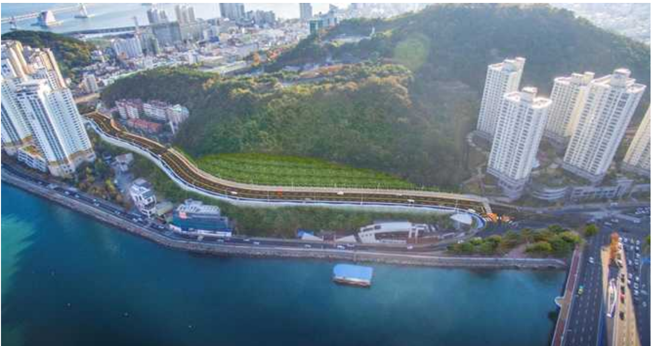
백산허리길 확·포장 공사 조감도