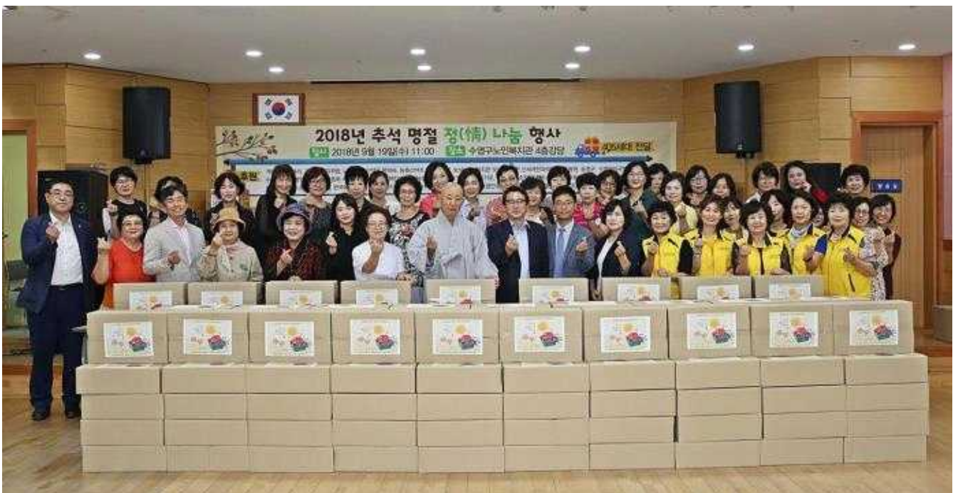
추석 명절 정 나눔 행사