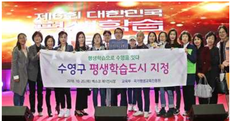
수영구 평생학습도시 지정