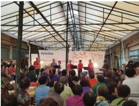
망미행복마을 골목축제 “소소한 잔치”