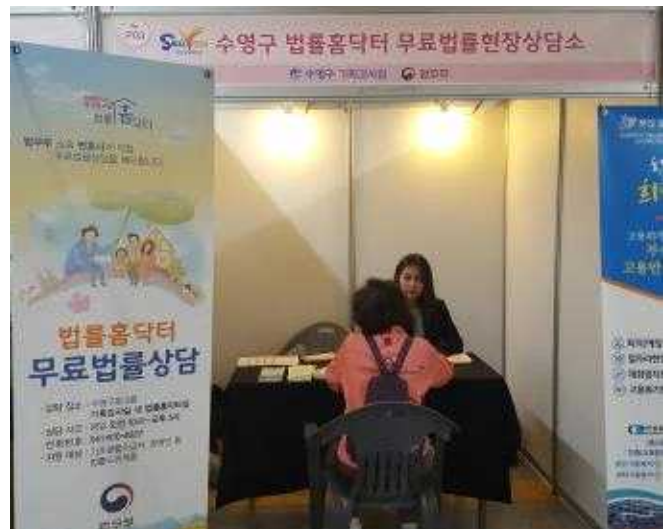
수영구 법률홈닥터 무료법률상담