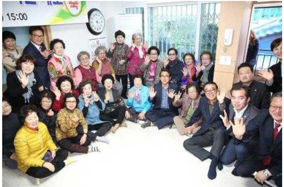
민락희춘경로당 이전 개소