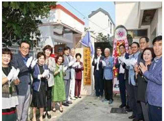
구구팔팔경로당 이전 개소