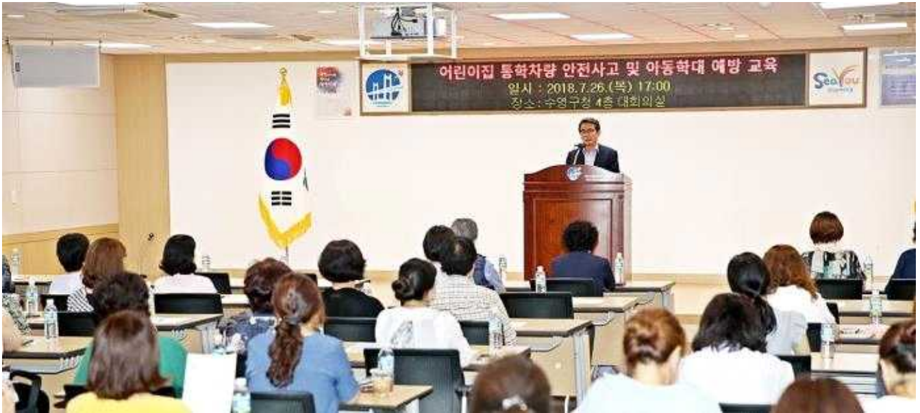
어린이집 통학차량 안전사고 및 아동학대 예방 교육