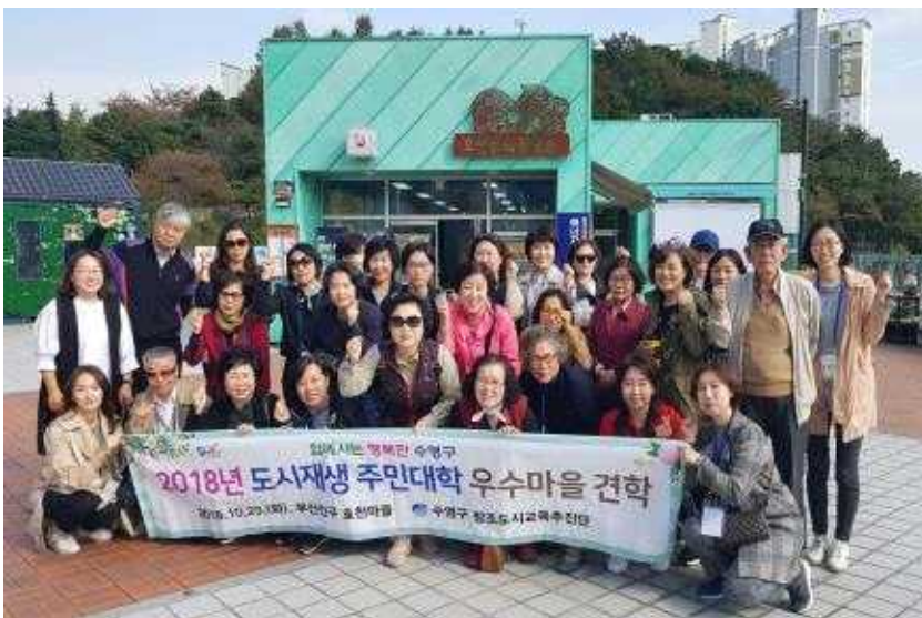
도시재생 주민대학 우수마을 견학