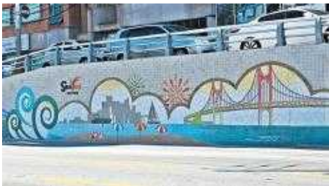
수영구-연제구 관문지점 도시환경정비