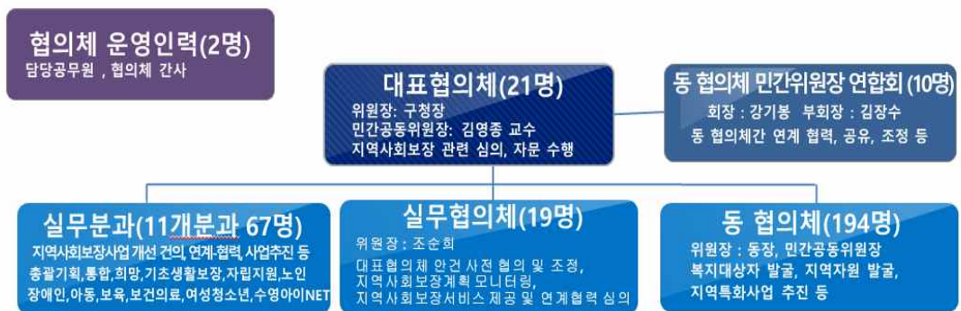
[ 수영구 지역사회보장협의체 구성 - 2019.12월말 기준 ]

2017년 7월 지역사회보장협의체 전담 간사를 채용하여 지역사회보장협의체 운영 및 민관협력 연계·협력을 강화하기 위한 기반을 마련하였다.