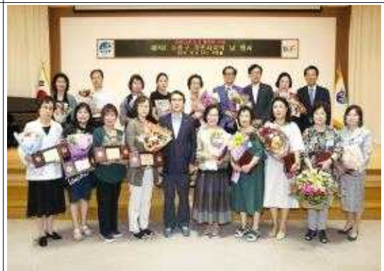
주민자치의 날(강연, 시상)