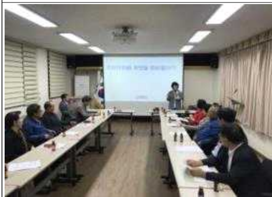
동 찾아가는 주민자치위원 교육