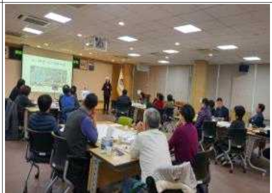
권역별 역량강화 컨설팅