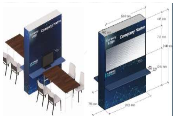
기업별 상담부스 조감도