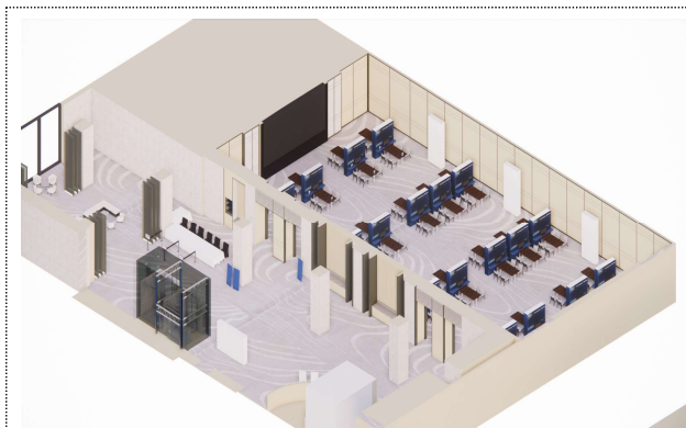
전체 전시·체험 행사장 조감도