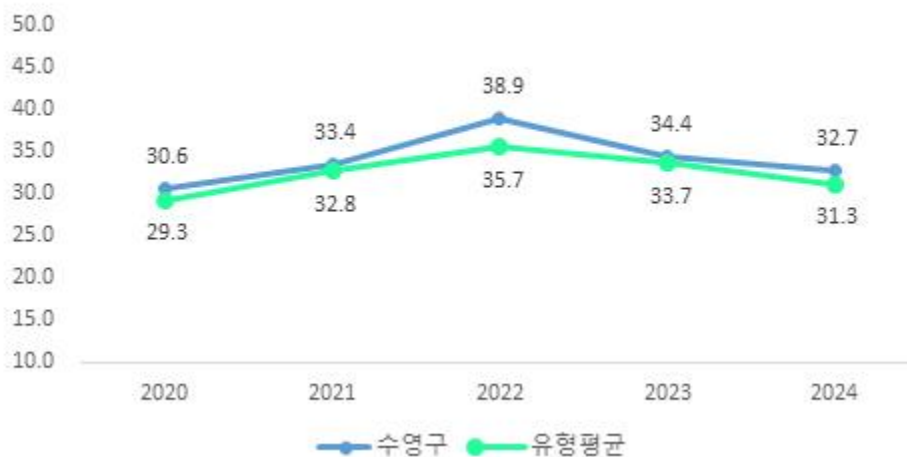
최근 5년 결산기준 재정자주도

수영구의 재정자주도는 '23년부터 다소 하락 추세이나 동일 지자체 유형평균 대비 양호한 수준입니다.