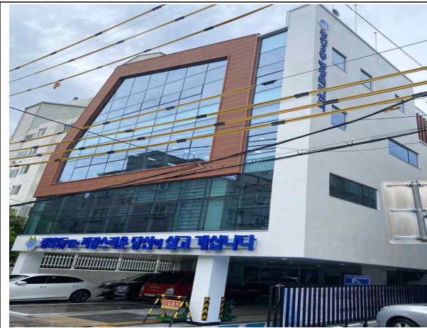
광안3동 행정복지센터 외관